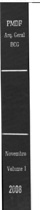
Ilustração 2: Vista lateral da lombada com aproximadamente 5 centímetros de largura.