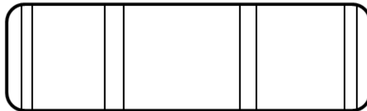
Figura 2 (almofada de proteção para ombros)