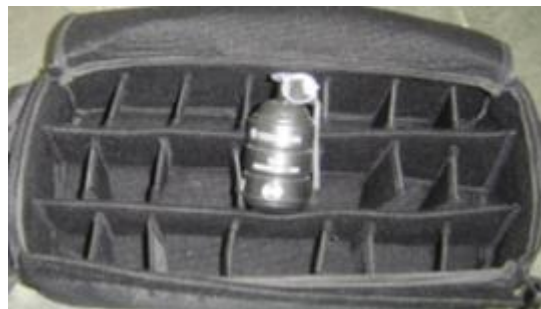
Figura 3 (interior do bornal de transporte de granadas)